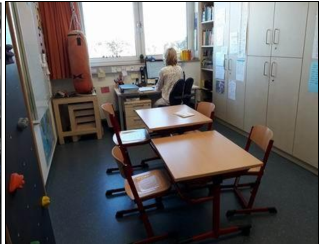
Schulraum der Ebene 6 (links) sowie Schulraum auf der Ebene 5 (innerhalb der Station A5, rechts)

Schwerpunkt-Stationen der Schule für Kranke im Kinderkrankenhaus sind chronische Erkrankungen (u. a. Diabetes, Rheuma, chronische Schmerzkrankungen, chronisch entzündliche Darmerkrankungen, CED, Epilepsie) sowie die Kinder-Onkologie.